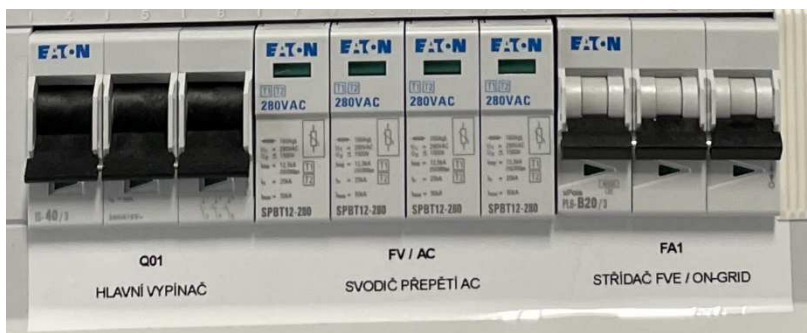
Obr.3 (Foto R-FVE-G2, G1 neobsahuje Svodič FV / AC)